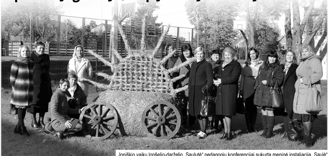
Joniškio vaikų lopšelio-darželio „Saulutė“ pedagogių konferencijai sukurta meninė instaliacija „Saulė“

Spalį darželyje vyko tarptautinė pažintinė-praktinė konferencija „Kaip senieji giedojo, taip jaunieji dainuoja“, skirta Tautinio kostiumo metams paminėti. Šios konferencijos tikslas – pasidalyti patirtimi, kaip įvairių netradicinių veiklų kūrimas ir integracija į ugdymo procesą leidžia atgaivinti pamirštus savo tautos papročius ir tradicijas. Renginyje dalyvavo ikimokyklinio ir priešmokyklinio ugdymo pedagogai iš Elėjos vaikų darželio „Kamenite“, Rygos lietuvių vidurinės mokyklos (Latvija) ir mūsų šalies ikimokyklinio ugdymo įstaigų: Telšių lopšelio-darželio „Mastis“, Kuršėnų lopšelio-darželio „Nykštukas“, Šiaulių lopšelio-darželio „Voveraitė“, Radviliškio lopšelio-dar-