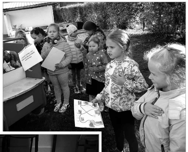
Darželio kieme pagal žemėlapi surastas punktas: „Paklauskite, kaip plaka širdis“

kokio ji dydžio, kiek kartų plaka per vieną minutę, kas širdžiai patinka ir kas nepatinka. Po diskusijos visi rinkosi kieme ir ruošėsi neįprastam bėgimui aplink darželį su orientacinio sporto elementais. Dalyviai gavo žemėlapi, kuriame buvo pažymėti aštuoni punktai, juos reikėjo surasti ir atlikti paruoštą užduotį. Teko ir skaičiuoti, ir mįslę įminti, ir ant vienos kojos šokuoti, ir